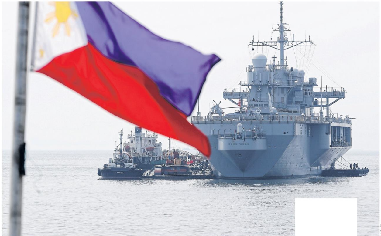
The USS Blue Ridge, the command ship of the US Navy's Seventh Fleet, sits anchored near Manila on March 13. Washington recently reiterated its pledge to defend the Philippines and keep the South China Sea open.